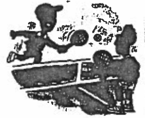
3. los chicos