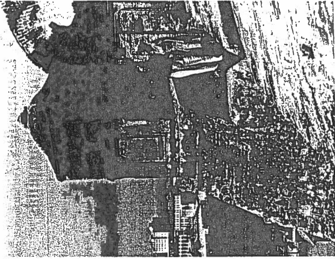
Fortaleza colombiana para la defensa contra los piratas